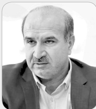
با تلاش مضاعف به افتخارات و توفیقات بیشتری در حوزه ورزش دست خواهیم یافت.

معاون توسعه امور ورزش: با تلاش همه جانبه اتفاقات خوبی در ورزش استان رخ داده است