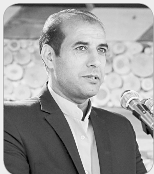
کل بدون وقفه در حال توسعه و افزایش بوده این کار وظیفه ما را در قبال قهرمانان پروری و جذب جوانان به ورزش، آموزش داوران و مربیان بیشتر می کند زیرا باید از این امکانات بخوبی استفاده کنیم.