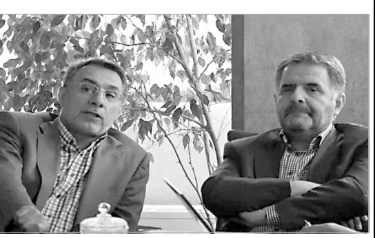
بر اساس قوانین و مقررات کشورمان به زودی منعقد خواهد شد.

به گزارش روابط عمومی سازمان صمت استان فارس، در این جلسه، توانمندی ها، ظرفیت ها، قابلیت ها، کار کردها و عملکرد برنامه های سازمان صمت در پیشبرد اهداف اقتصادی و توسعه فعالیت های تولیدی و توزیعی در راستای اشتغال پایدار، رفع بیکاری، رشد صادرات و جهش اقتصاد استان و کشور بررسی شد.